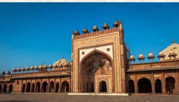
Fatehpur Sikri, Jama Masjid

Nach dem Frühstück machen wir uns auf den Weg nach Jaipur. Unterwegs besuchen wir die Wüstenstadt Fatehpur Sikri, auch „Siegstadt“ genannt. Die UNESCO Welterbestätte wurde im späten 16. Jahrhundert vom Großmogul Akbar als Residenzstadt und Zentrum des Reiches in aller Pracht gebaut – und nach nur 14 Jahren wieder verlassen. Militärische Gründe und eine mangelhafte Wasserversorgung verwandelten die einstige Hauptstadt in eine Geisterstadt. Im Hotel Umaid Lake Palace in Kalakho werden wir zum Mittagessen erwartet. Das Hotel verfügt über 20 Hektar Land, umgeben von landwirtschaftlichen Betrieben, die sich gemeinsam mit dem Umaid Lake Palace auf biologischen Anbau spezialisiert haben. Bei einer Traktorfahrt erkunden wir diese ländliche Idylle. Der sogenannte Juggad führt uns durch weitreichende Weiden, Koriander- und Chilifelder. Später erreichen wir Jaipur, die Hauptstadt Rajasthans. Ein Besuch des Prince of Wales im Jahre 1876 war Anlass, alle Häuser der Stadt mit einer schönen, rötlich-braunen Farbe zu bemalen. Ein Brauch, der noch heute in der Altstadt eingehalten wird und der die Stadt als „Pink City“ weltberühmt gemacht hat. Mit ihren Sehenswürdigkeiten diente Jaipur schon oft als Filmkulisse und auch die erfolgreiche britisch/indische Komödie „The Best Exotic Marigold Hotel“ wurde hier gedreht. Abendessen im Hotel in Jaipur.