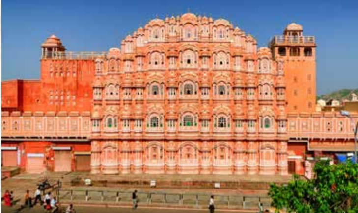
Palast der Winde, Hawa Mahal, Jaipur