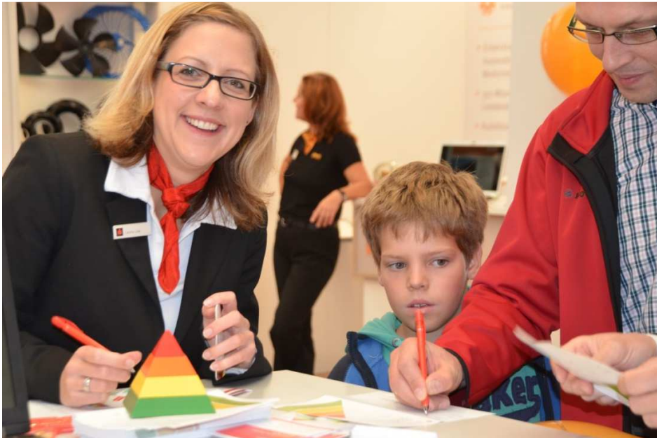
Am Sparkassenstand auf der Hohenloher Wirtschaftsmesse in Künzelsau